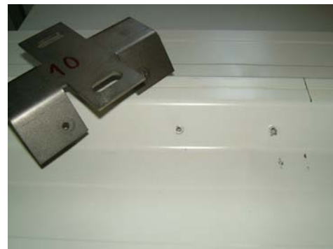
Ansicht nach Maximalbelastung