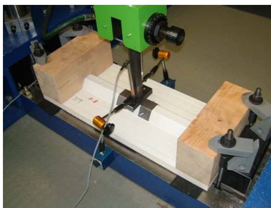
Prüfung mit zentrischer Belastung