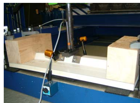
Prüfling unter Last