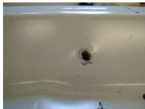
Ansicht nach Maximalbelastung