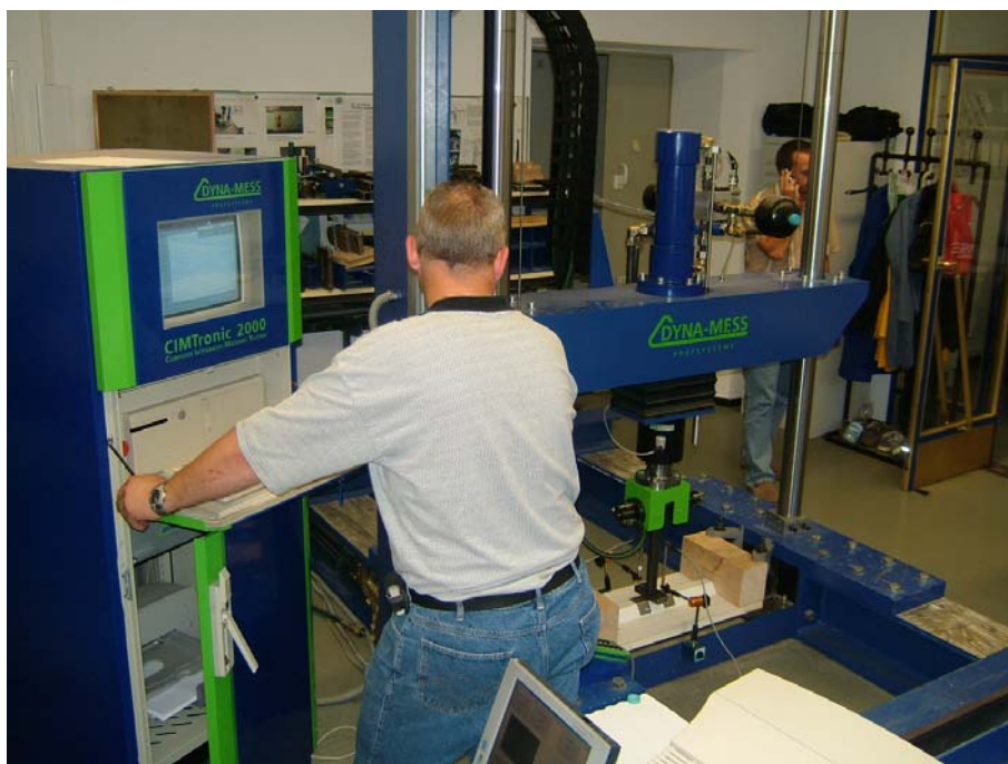
Prüfaufbau Belastungsanlage mit Prüfling

Die hier aufgeführten Bilder geben einen Überblick zu den Versuchsaufbauten.