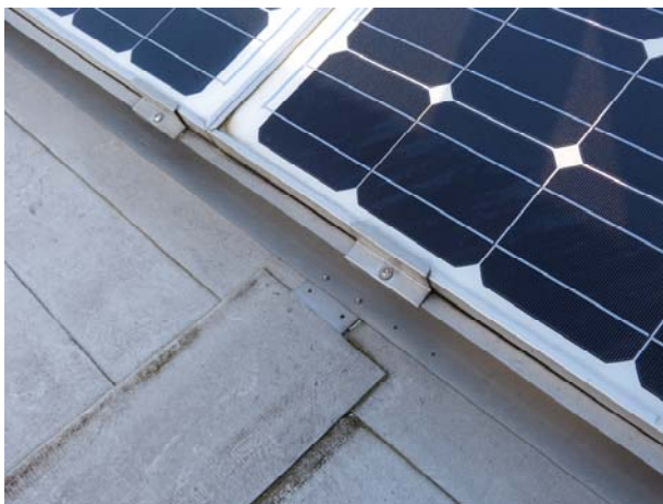
Bild 1 Fixierung mit Klebelaschen auf Folie

Insbesondere bei Gebäuden mit geringen Tragreserven, aber zunehmend auch im normalen Wettbewerbsumfeld, werden Befestigungslösungen verwendet, bei denen das Montagegestell mit verklebten Folienlaschen (Bild 1) oder verschweißten Bitumenbahn-Streifen (Bild 2) mit der Dachhaut verbunden wird. In diesen Fällen wird dann im Regelfall auf eine Ballastierung des Montagegestells verzichtet.