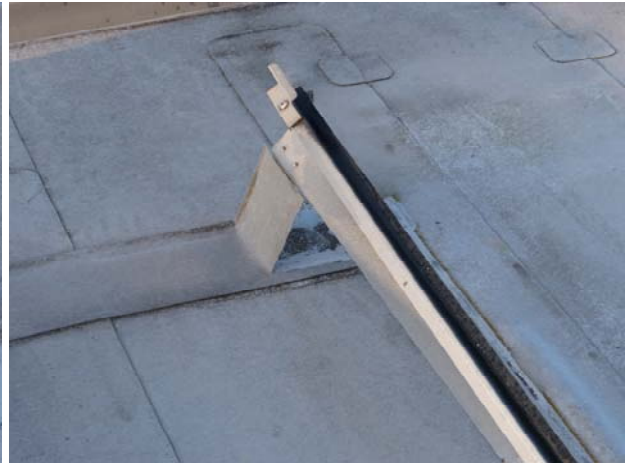
Bild 9 Versagen durch Reißen der Klebelasche

Zusammenfassend kann festgehalten werden, dass Verklebungen von Solargeneratoren auf Foliendächern oder Verschweißungen an Bitumenbahnen aufgrund unzureichender Erfahrung mit planmäßiger Zug- und Schubbelastung ein erhebliches Risiko darstellen, welches auch aus der baurechtlichen Forderung nach Gewährleistung der Standsicherheit nicht hinnehmbar ist. Zwingende Voraussetzung ist eine allgemeine bauaufsichtliche Zulassung durch das Deutsche Institut für Bautechnik (DIBt).