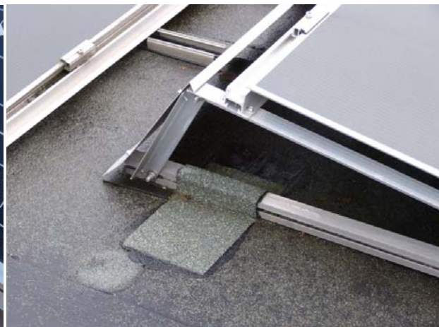
Bild 2 Fixierung mit geschweißten Laschen auf Bitumen