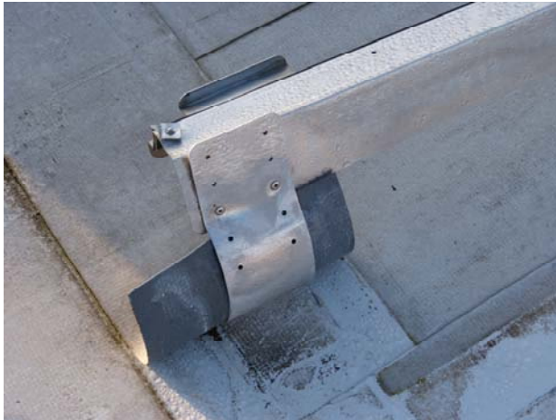
Bild 8 großflächige Ablösung der Klebe-Lasche

Bild 6 verdeutlicht den Übergang zwischen Klebelasche, Metallstreifen und dem Gestell im Anschlussbereich. In den Abbildungen 7-9 sind generell 3 unterschiedliche Versagensformen zu erkennen. Bild 7 zeigt ein lokales Ablösen der Klebelasche, was sicherlich auch durch die geringe Biegesteifigkeit des Flachblechs begünstigt wurde. In Bild 8 ist ein großflächiges Ablösen der Klebelasche dargestellt. Anhand der hellen Verfärbungen auf der Unterseite der Klebelasche kann vermutet werden, dass diesem Stadium der Zustand in Bild 7 vorausgegangen ist. Bild 9 verdeutlicht ein Versagen durch Reißen der Folienlasche. Auch hier dürfte ein lokales Ablösen durch Schälspannung vorausgegangen sein. Begünstigend können sich hier auch Effekte wie Verschmutzung in der Klebefuge oder Alterungsprozesse an der Folienoberfläche vor dem Kleben auswirken.