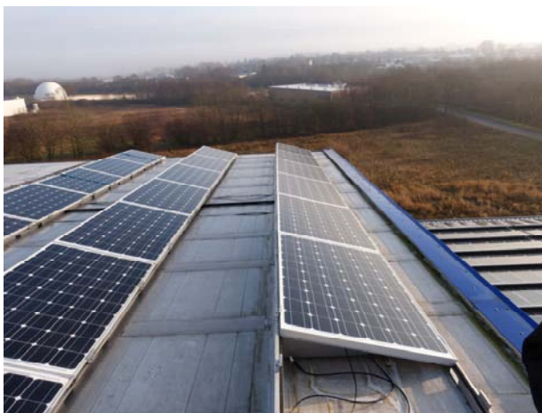
Bild 4 aufgeständertes System

Bild 3 zeigt einen Zugversuch in einer Klimakammer bei einer Temperatur von 80°. Als wesentliche Erkenntnis ist daraus abzuleiten, dass bei hohen Temperaturen mit der Belastung erhebliche Verformungen einhergehen, die mit hoher Wahrscheinlichkeit nicht reversibel sind. Des Weiteren ist anhand der Verformungsfigur deutlich nachvollziehbar, dass Spannungskonzentrationen mit ausgeprägter Schälwirkung am Anschluss zwischen der Lasche und der Dachfolie auftreten. Die zuvor verwendeten Begrifflichkeiten sollen nachfolgend exemplarisch anhand eines Schadenfalls aus dem Herbst 2013 verdeutlicht werden. Entsprechend Bild 4 handelt es sich um ein aerodynamisch optimiertes System mit Rückwandblechen, bei dem hintereinander angeordnete Reihen durch Metallbänder miteinander verbunden sind. Über diesen Metallbändern ist über die gesamte Länge eine verklebte Lasche aus Folie angeordnet (Bild 5). Bei der ersten und letzten Reihe sind die Metallanschlüsse in einer Art Folientasche eingelegt.