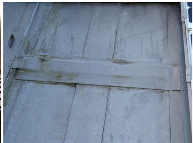
Bild 5 Klebelaschen über Verbindungsblechen