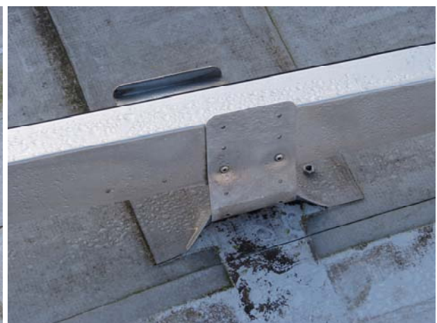
Bild 7 lokale Ablösung der Klebelasche durch Schälen