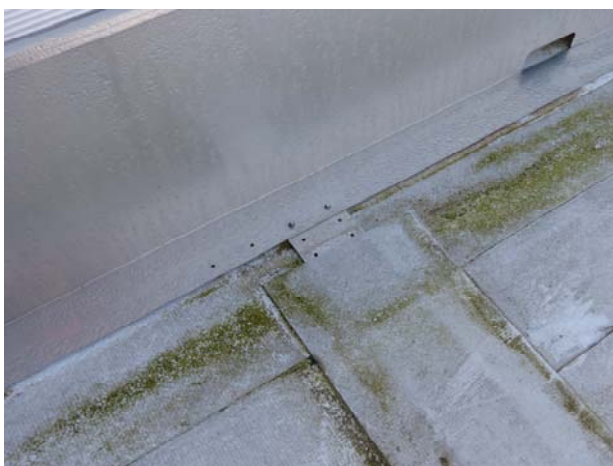
Bild 6 Anschlussdetail